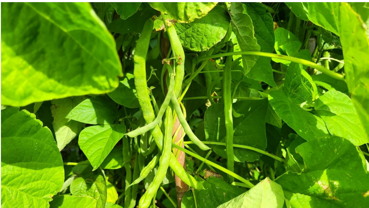
De spekbonen zijn klaar om te oogsten!

Men hoeft niet te wachten tot de Open Dag om groenten van de vereniging te kopen. Men kan ze ook vooraf kopen. Er zijn voldoende aardappelen voorradig, evenals spekbonen en prei. Belangstellenden kunnen zich via de mail of telefoon melden. Een berichtje naar penningmeesterdvt@hotmail.com is voldoende om je belangstelling kenbaar te maken. Wel duidelijk vermelden wat je wensen zijn. Er wordt vervolgens telefonisch contact met je opgenomen.