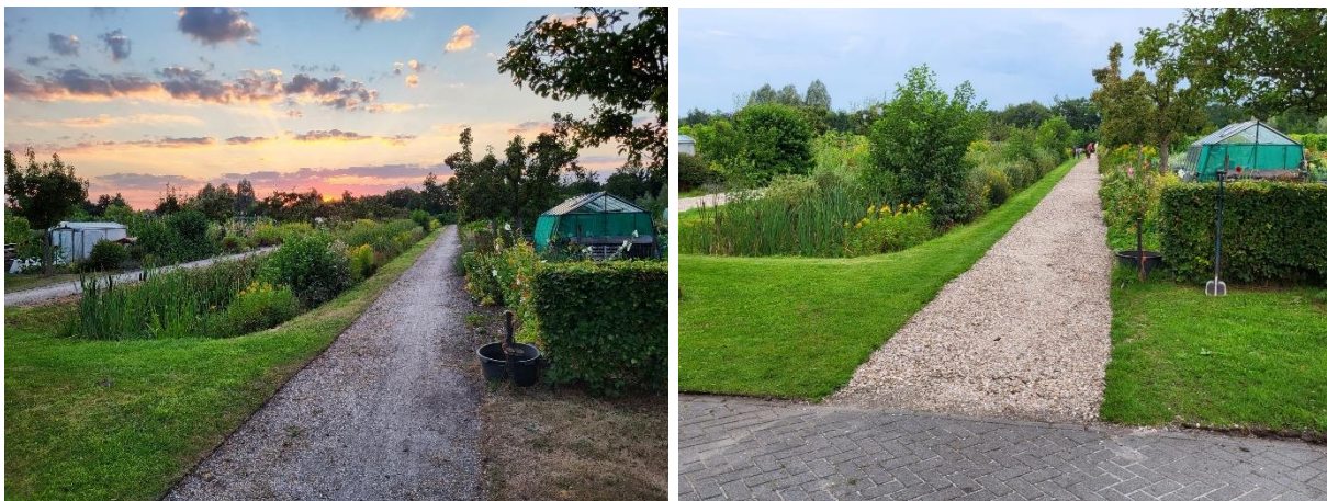
Het hoofdpad voor en na het aanbrengen van nieuwe schelpen!

De Open Dag komt eraan en dat betekent dat er altijd een drukke periode voor de boeg staat. Groenten moeten worden geoogst voor de verkoop, het complex wordt netjes gemaakt en natuurlijk de voorbereidingen voor de open dag zelf. In deze nieuwsbrief staan zijn alle details hieronder te lezen.