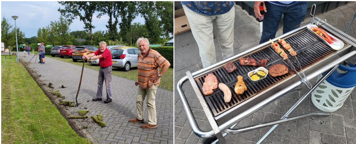
Op zaterdag 19 augustus zijn vrijwilligers druk doende het terrein in nette staat te krijgen (links). De BBQ van vorig jaar was een groot succes (rechts).